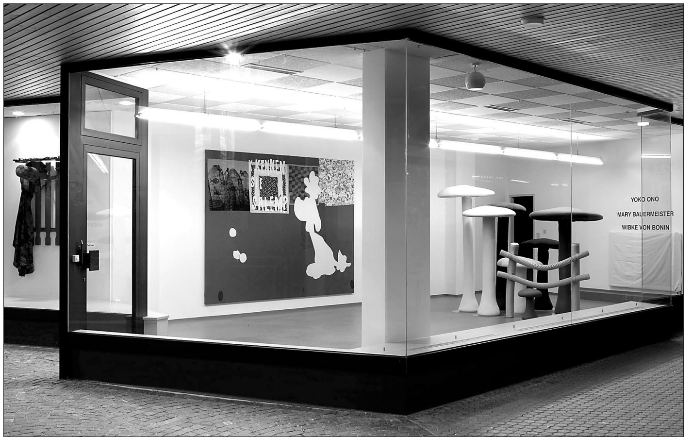
Cosima von Bonins Skulpturengruppe »Robbing Peter to Pay Paul« gehört zu den edlen Werken der Konzeptkunst.