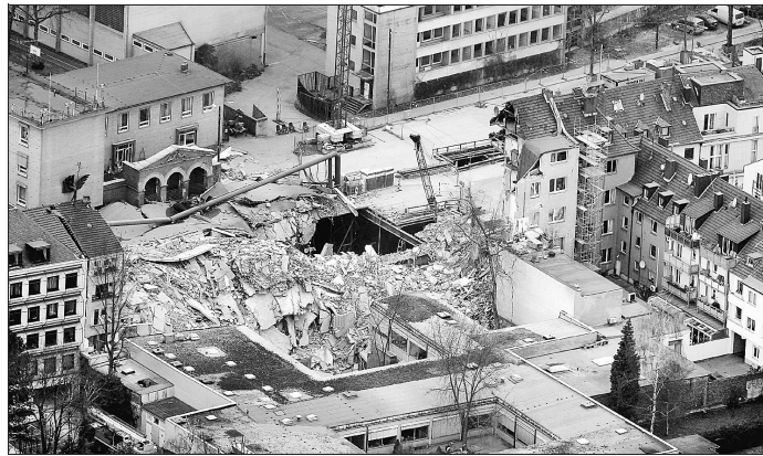
Ein Blick zurück auf die Folgen des Einsturzes des Kölner Historischen Stadtarchivs.